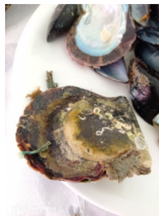
Εικόνα 1. Το στρειδόκτενο Pinctada imbricata radiata .